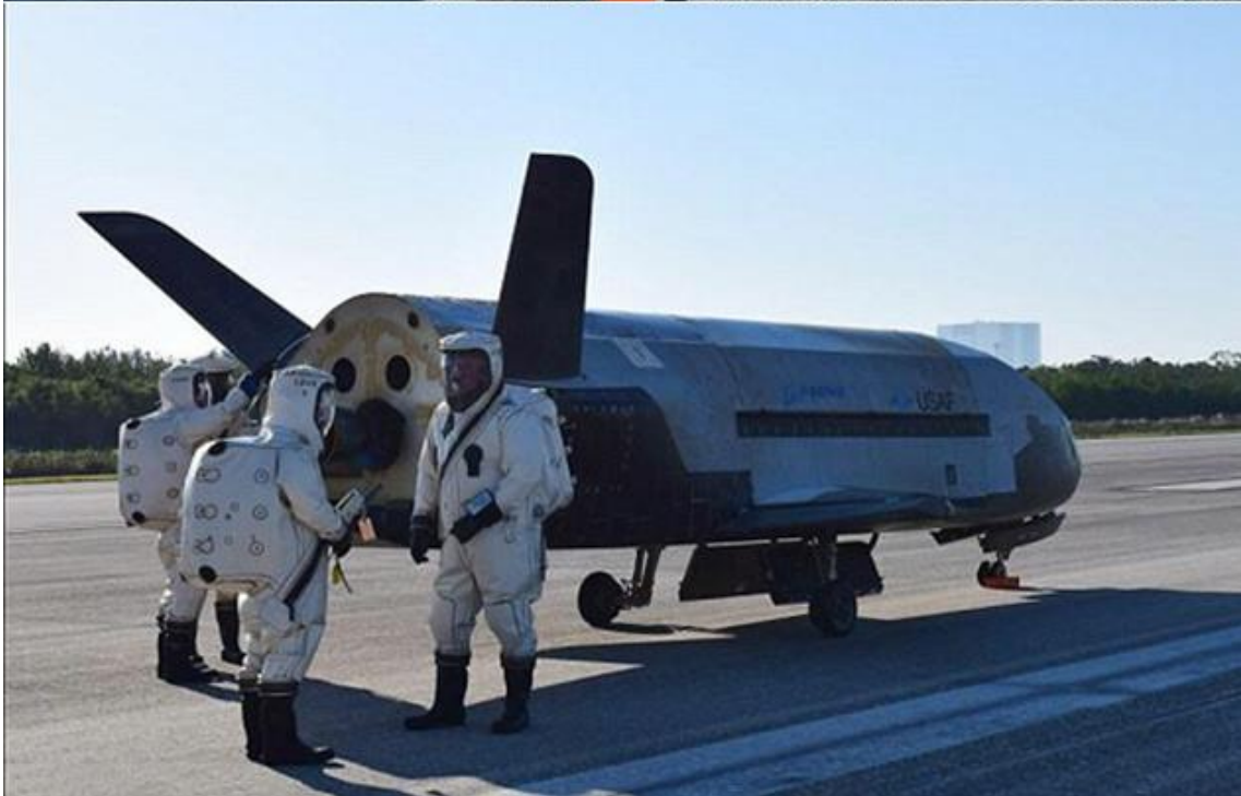
O Boeing X-37B