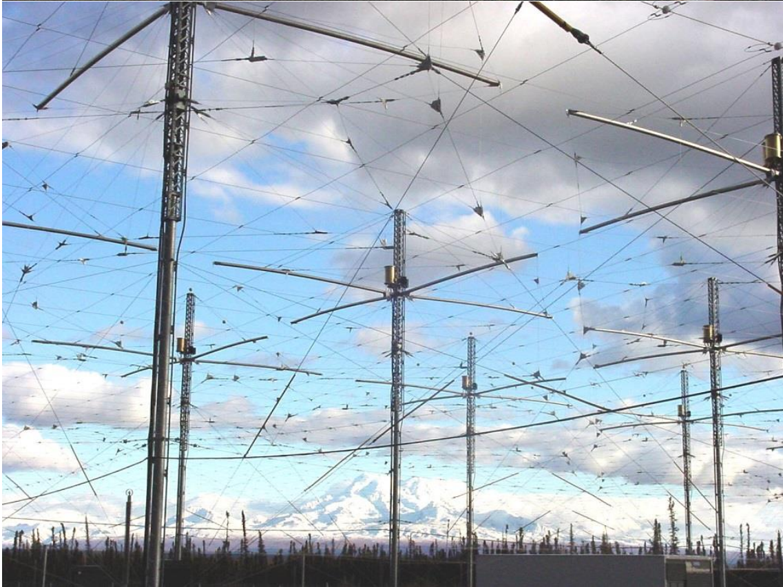
Instalações da HAARP